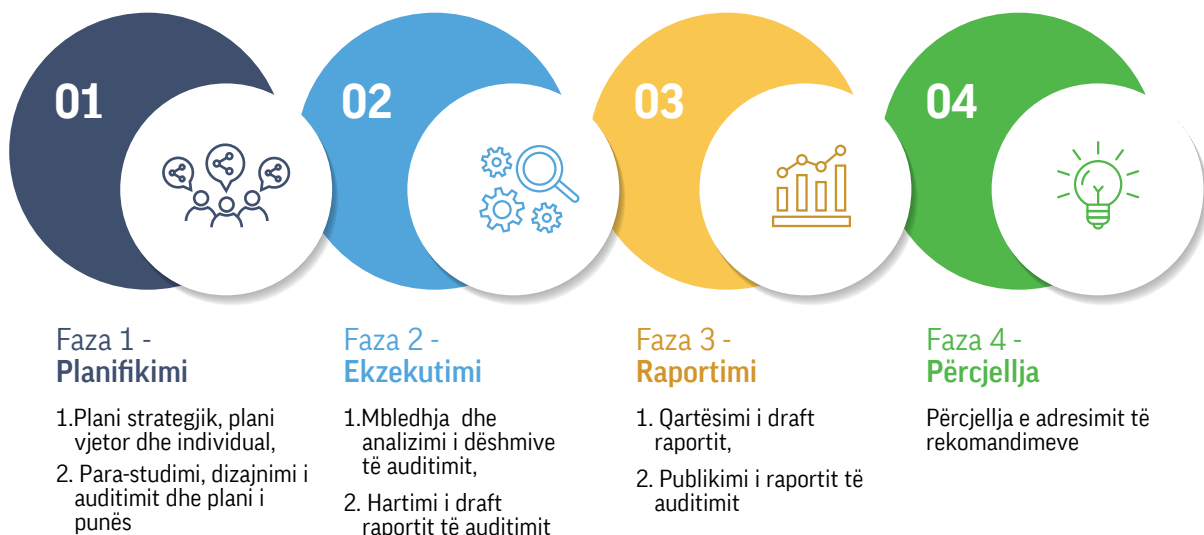
Grafiku 2: Fazat e procesit të auditimit të performancës

Faza 1. Planifikimi. Përfshinë propozimin e temave për auditim dhe përgatitjen e memove parastudimore. Propozimet shqyrtohen përmes një procesi vlerësues lidhur me përshtatshmërinë dhe rëndësinë e temës për t'u audituar. Në këtë fazë po ashtu, ekipet e auditimit bëjnë një hulumtim më të thellë rreth temës