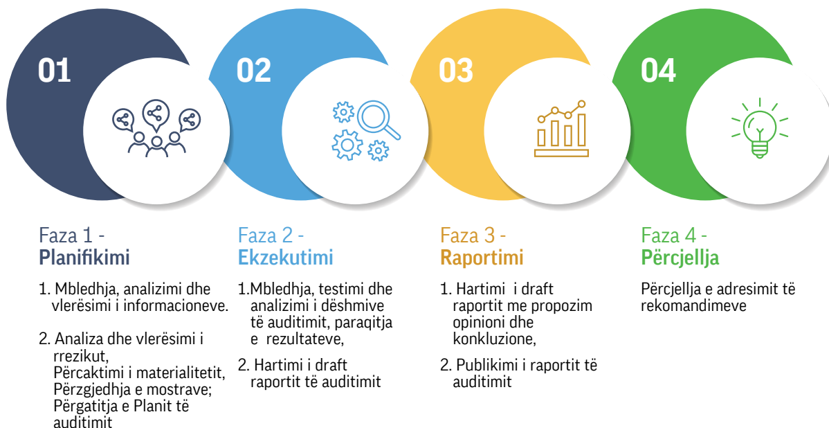
Grafiku 1: Fazat e procesit të auditimit financiar dhe pajtueshmërisë.