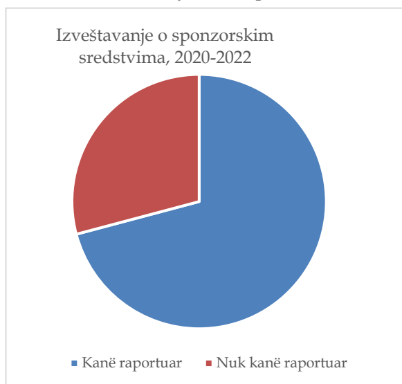
Grafikon 2: Izveštavanje nakon sponzorstva, 2020-2022.

Iz analize uzoraka sponzorstva sprovedenih tokom 2020-2022, primetili smo da se 64% korisnika sponzorstva izveštavali nakon sponzorstva. Dok 36% korisnika nisu izveštavali o načinu trošenja sponzorskih sredstava.