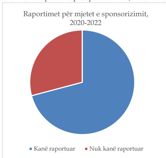
Grafiku 2: Raportimet pas sponsorizimit, 2020-2022.

Nga analiza e mostrave të sponsorizimit të realizuara gjatë viteve 2020-2022, kemi vërejtur se 64% e përfituesve të sponsorizimit kanë raportuar pas sponsorizimit. Ndërsa, 36% të përfituesve nuk kanë raportuar për mënyrën e shpenzimit të fondeve të sponsorizimit.