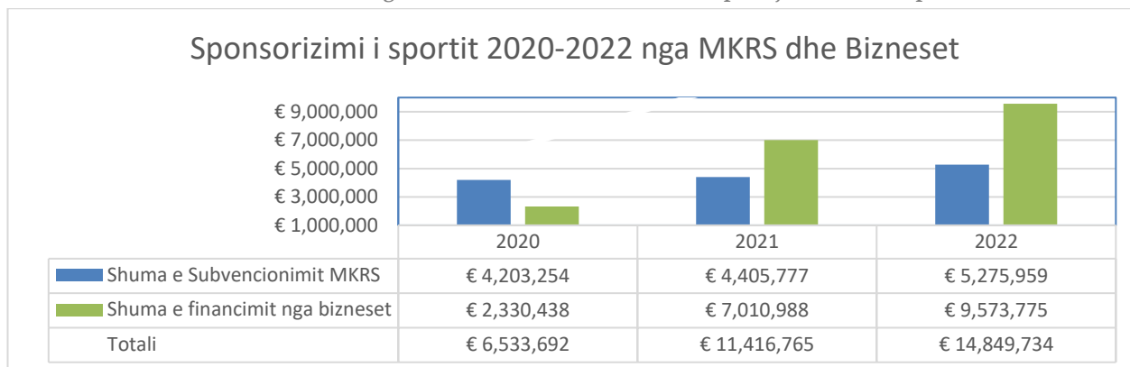
Grafiku 1: shumat e subvencionimit nga ana e MKRS-se dhe bizneset nëpërmjet formës së sponsorizimit 7 .