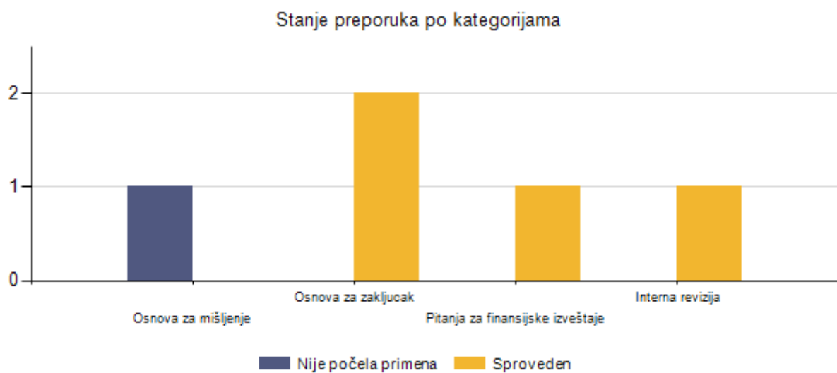
Tabela 4 Rezime preporuka iz prethodne godine