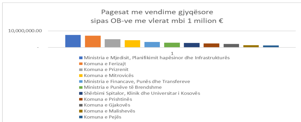
Grafiku 1. Pagesa të kryera me vendime gjyqësore sipas OB-ve me vlerat më të larta

Moskryerja e detyrimeve me kohë nga ana e organizatave buxhetore, ka rezultuar me kosto shtesë për buxhetin e shtetit për shkak të kostove të procedurave gjyqësore (përmbartimore) dhe shpenzimeve të interesit. Këto kosto shtesë kanë dëmtuar buxhetet e këtyre OB-ve dhe rrjedhimisht edhe objektivat e parapara t'i realizonin me ato mjete. Marrë parasysh faktin se një pjesë të madhe të këtyre shpenzimeve e përbëjnë investimet kapitale, i bie se shumë projekte kanë mbetur pa u realizuar si rezultat i këtyre kostove.